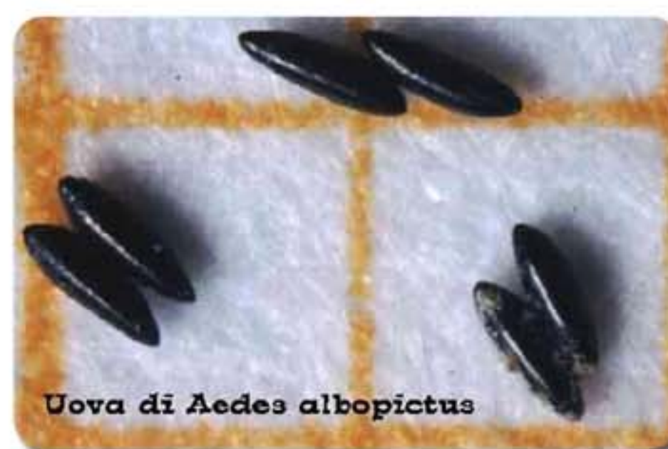
Uova di Aedes albopictus